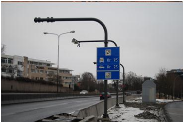
Eksempel på vejkantudstyr i Oslo

Det bemærkes, at der i en anlægslov vil skulle tilvejebringes hjemmel til videoovervågning, til opslag i motorkøretøjsregistret samt til at pålægge gebyr for unddladelse af rettidig betaling. For Storebæltsforbindelsen indeholder Sund & Bælt loven sådanne lovbestemmelser.