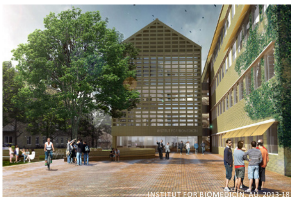
INSTITUT FOR BIOMEDICIN, AU, 2013-18

Vi laver meget uddannelsesbyggeri, og opfører instituttet for Biomedicin på Aarhus Universitet – et forskningsområde hvor Danmark er helt fremme på verdensplan.