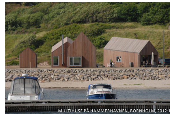
MULTIHUSE PÅ HAMMERHAVNEN, BORNHOLM, 2012-14

Og vi er også glade for de mindre opgaver – her er det Hammerhavens multihuse på Bornholm.