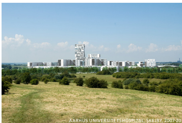
AARHUS UNIVERSITETSHOSPITAL, SKEJBY, 2007-20

Jeg er partner i Cubo, et middelstort arkitektfirma og jeg er adjungeret professor i Aalborg med baggrund i min praksis hvor vi har fokuseret på offentligt byggeri som Aarhus Universitetshospital – så vi kender til supersygehusenes visioner om Helende byggeri. Men også de store udfordringer, eller rettere samfundets udfordring med at bygge 5 sygehuse til 40 milliarder oven i hinanden – det er dog en forelæsning for sig selv.