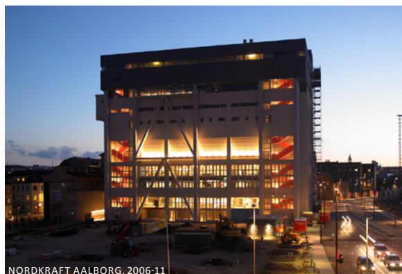
NORDKRAFT AALBORG, 2006-11

I kan kende universitetets gule teglbygninger og læg mærke til gavlmotivet – vi synliggør' det nye, i gavlens perforerede facade og viderefører dermed en tradition for forandring.