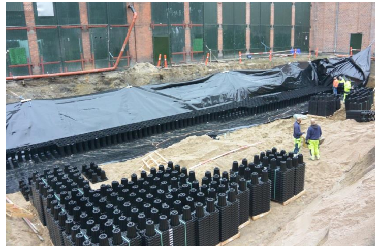
ACO StormBrixx leveres med 16 grundelementer pr. palle, hvilke svare til 3,5 m 3 faskine