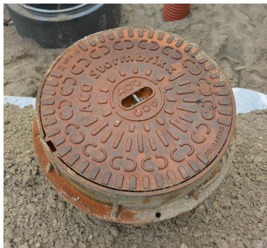
Inspektionselement for inspektion og vedligeholdelse afsluttes med specielt karm/dæksel mærket med ACO StormBrixx