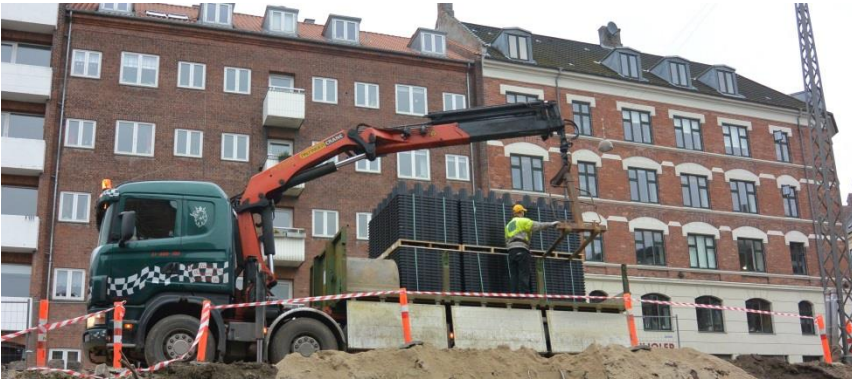
ACO StormBrixx ankomer