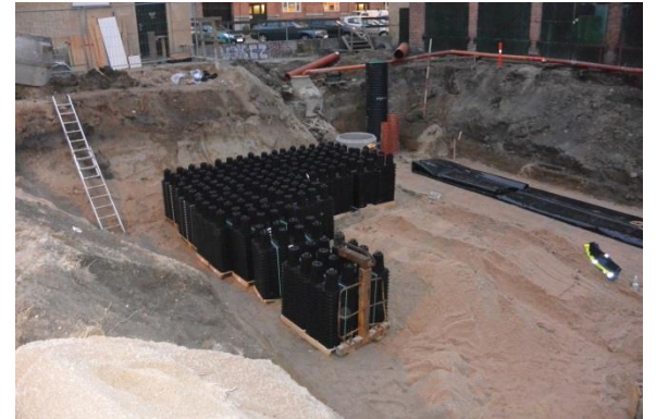
ACO StormBrixx klar til installering