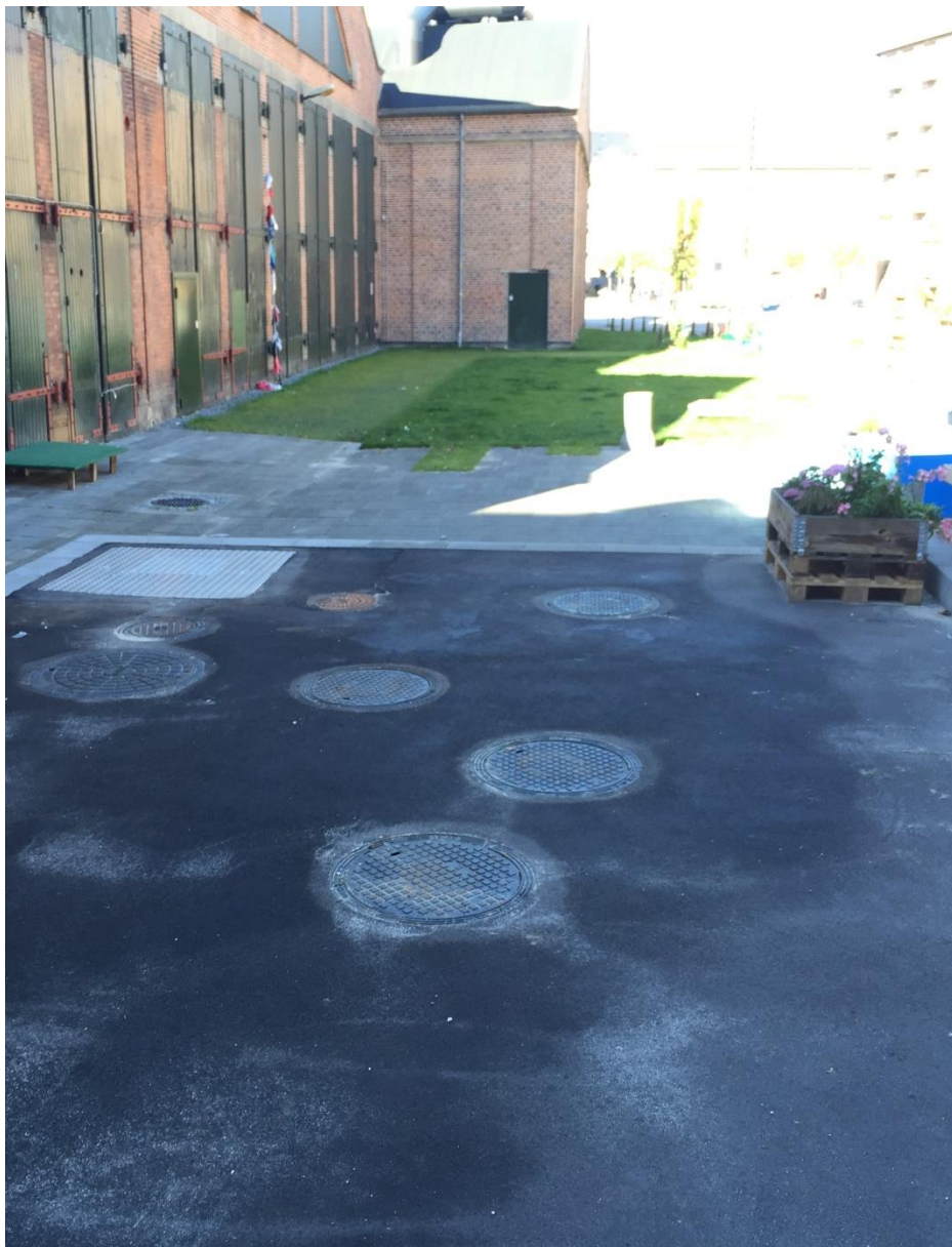
Efter endt installation er forpladsen nu blevet til et brugbart friareal.