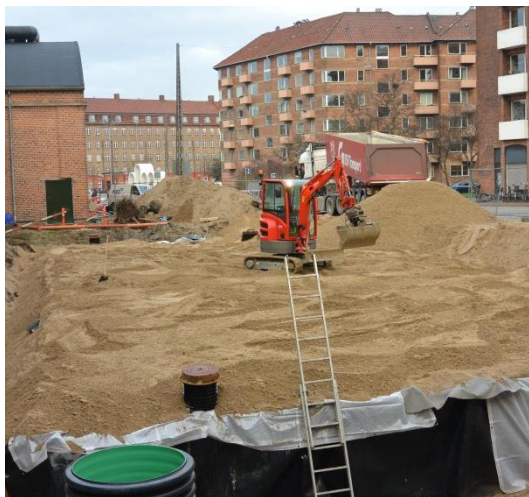
De færdig monterede StormBrixx elementer dækkes slutligt med grus før endelig belægning udføres