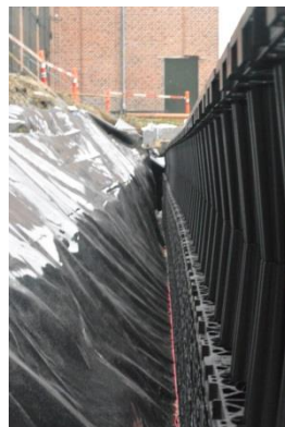
Udvendig side af StormBrixx, før øverste rækkesidepaneler fastklikkes