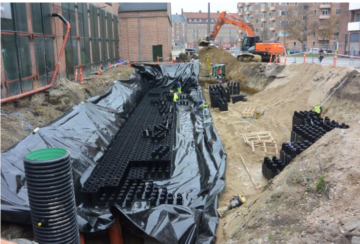
Membran udlægges og montering af ACO StormBrixx starter