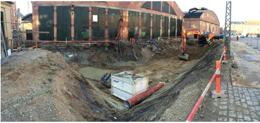
Udgravning for ACO StormBrixx