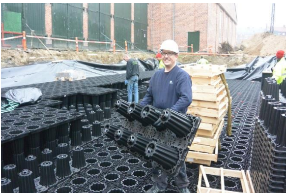
Med en vægt på kun 10 kg, kan de enkelte elementer hurtigt inatalleres